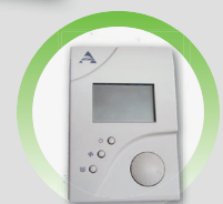
CDRD Thermostat digital