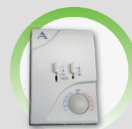
CDRA Thermostat manuel / automatique