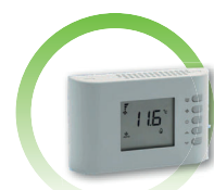
CR26 Thermostat digital, montage à distance