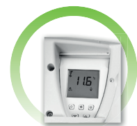
CBE26 Thermostat digital, montage à bord